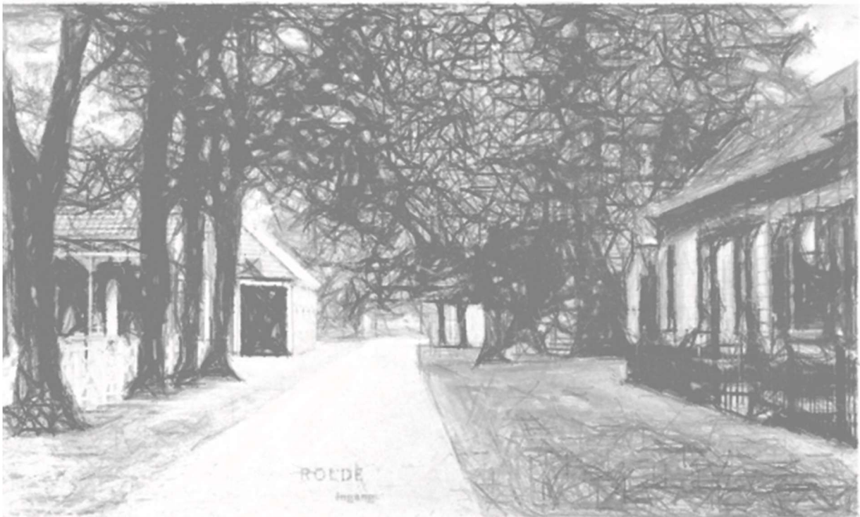
Poort van Rolde

Het bestuur stelt voor het Jaarverslag van het bestuur, de redactie en werkgroepen vast te stellen, met dank aan de diverse opstellers.