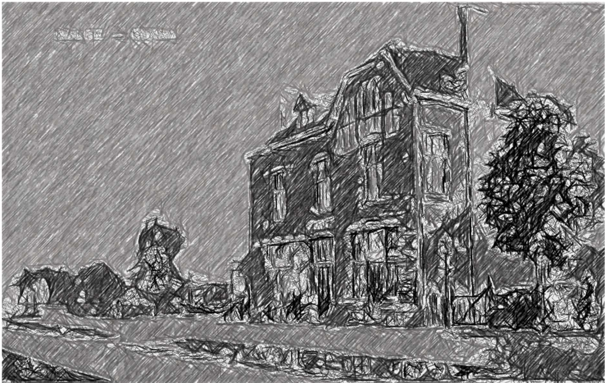
v/h NOLS spoorstation Rolde