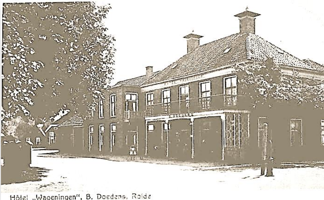
Verhaal over 'Hotel Wageningen', gepubliceerd in december 2024 (Kloetschup)

In het nieuwe jaar zal dit nader worden onderzocht en verkend.