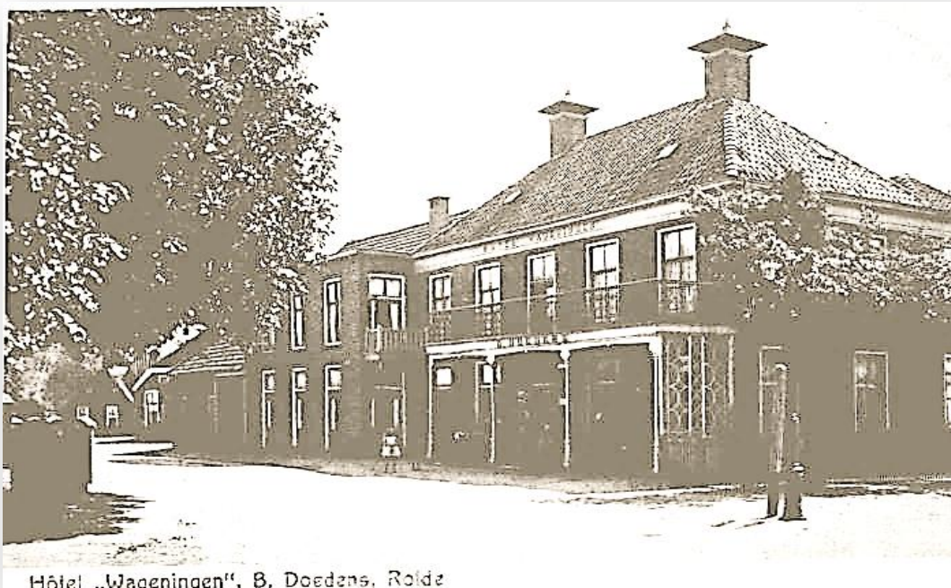
Verhaal over 'Hotel Wageningen', gepubliceerd in december 2024 (Kloetschup)

In het nieuwe jaar zal dit nader worden onderzocht en verkend.