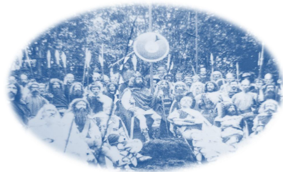
Opvoering in Balloërkuil Bij Klimmender Zonne in 1895

Tevens is er een werkgroep opgestart ter voorbereiding van de activiteiten rond ons 55-jarig jubileum. En hebben we het initiatief genomen om te komen tot afstemming tussen de diverse organisaties met activiteiten rond 80 jaar bevrijding.