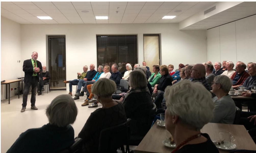
Lezing Struikelstenen